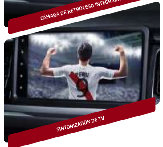
SINTONIZADOR DE TV