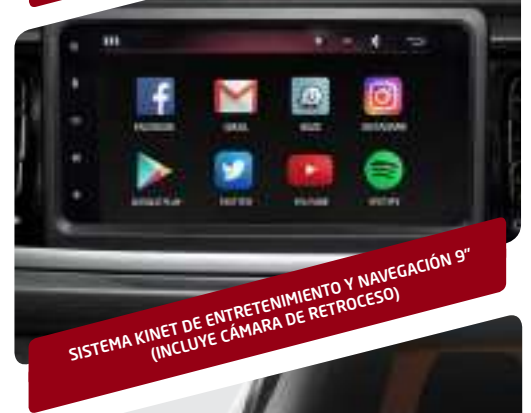
SISTEMA KINET DE ENTRETENIMIENTO Y NAVEGACIÓN 9" (INCLUYE CÁMARA DE RETROCESO)