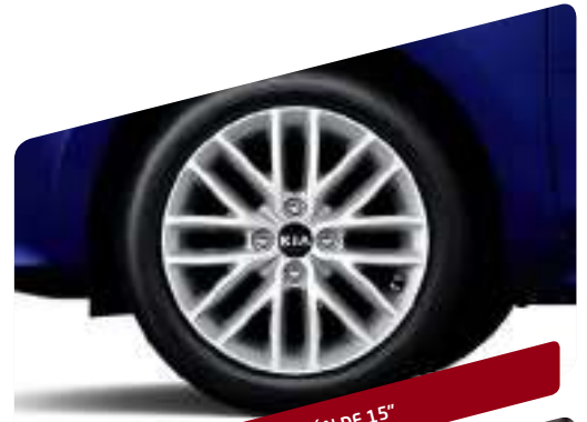
AROS DE ALEACIÓN DE 15"