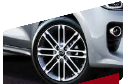
AROS ALEACIÓN DE 17"