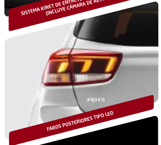
FAROS POSTERIORES TIPO LED