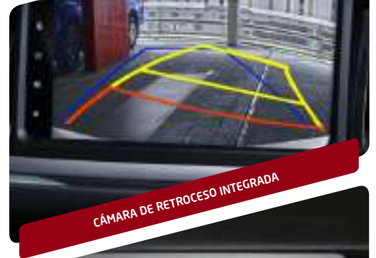
CÁMARA DE RETROCESO INTEGRADA