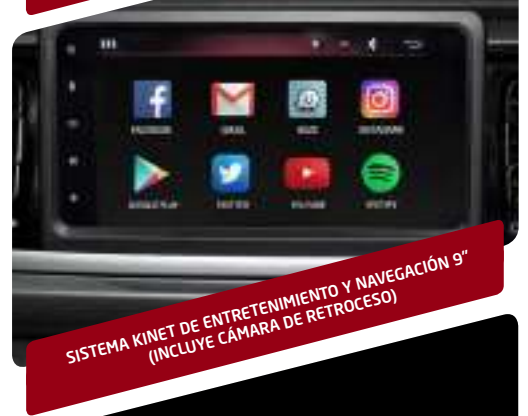
SISTEMA KINET DE ENTRETENIMIENTO Y NAVEGACIÓN 9" (INCLUYE CÁMARA DE RETROCESO)