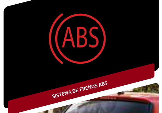
SISTEMA DE FRENO ABS