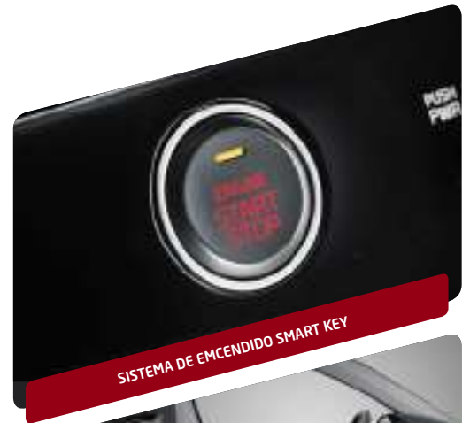
SISTEMA DE ENCENDIDO SMART KEY