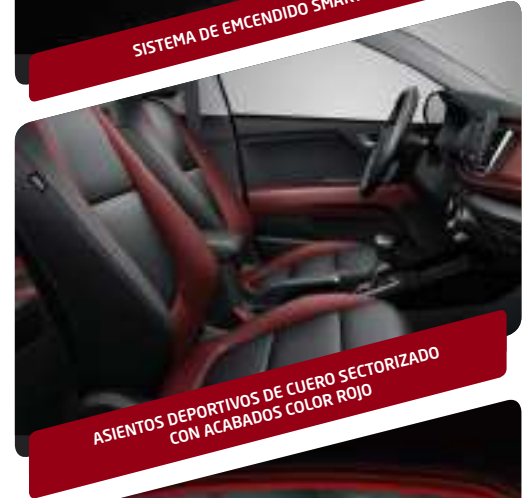
ASIENTOS DEPORTIVOS DE CUERO SECTORIZADO CON ACABADOS COLOR ROJO