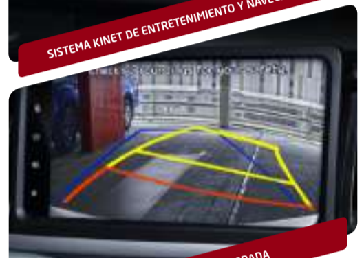
CÁMARA DE RETROCESO INTEGRADA