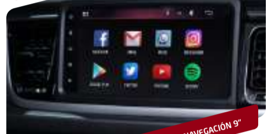
SISTEMA KINET DE ENTRETENIMIENTO Y NAVEGACIÓN 9"