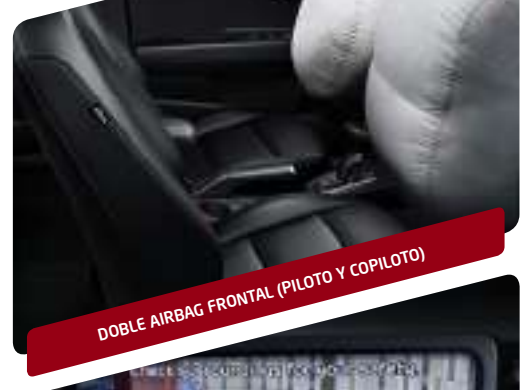
DOBLE AIRBAG FRONTAL (PILOTO Y COPILOTO)