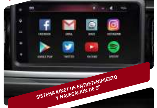
SISTEMA KINET DE ENTRETENIMIENTO Y NAVEGACIÓN DE 9"