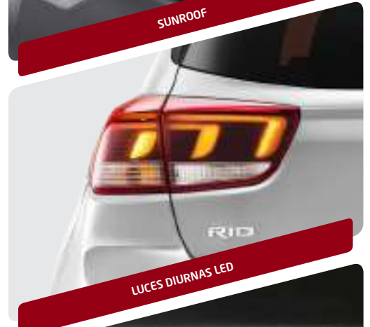
LUCES DIURNAS LED