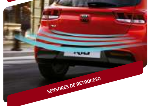
SENSORES DE RETROCESO