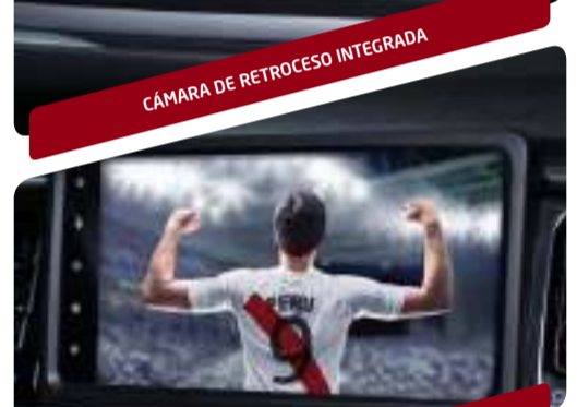
SINTONIZADOR DE TV