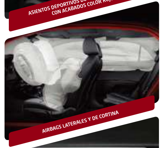
AIRBAGS LATERALES Y DE CORTINA